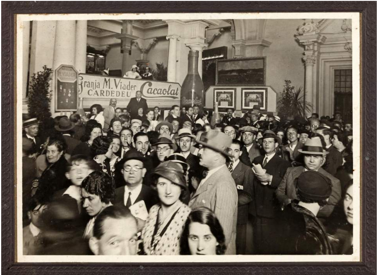
Estand de Cacaolat a la VI Fira de Mostres de 1933, any en què es va presentar la marca