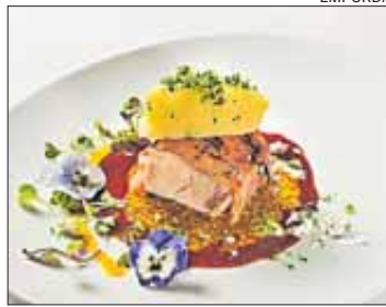
Els tastets són molt creatius.

Del estudi d'impacte econòmic es desprèn que la despesa mitjana a Figueres de cadascuna de les persones que va degustar els Tastets Surrealistes va ser de 63,03 euros