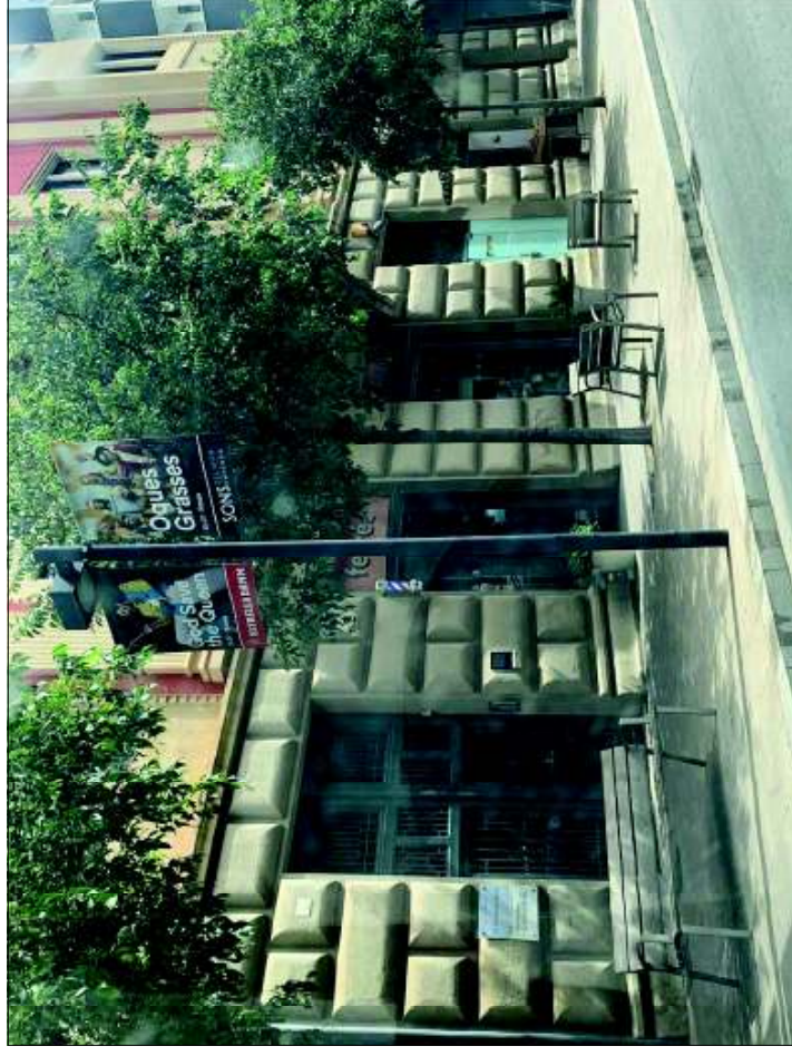
Façana situada Avinguda Vilallonga, 5