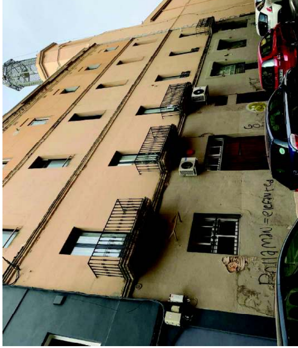
Façana situada a Carrer Mar, 6